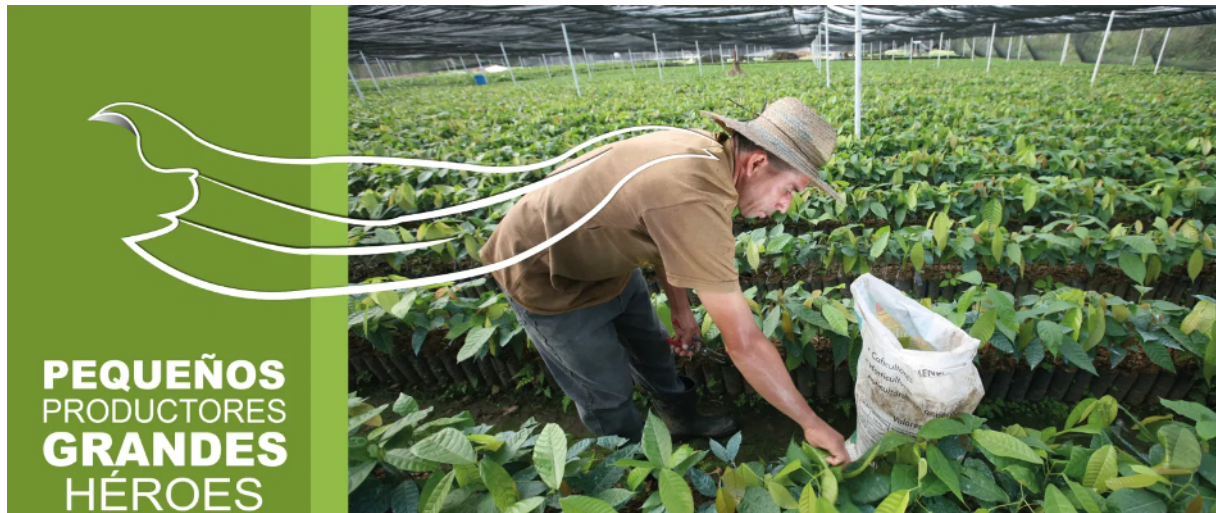
Petits producteurs, grands héros

D'autres arguments motivent votre volonté d'agir ? Partagez-les avec nous ! Envoyez-les à moien@fairtradegemeng.lu et nous les partagerons avec les autres communes.